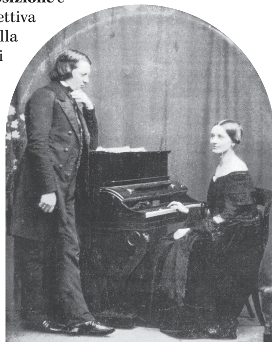
▲ Robert Schumann e Clara Wieck, in un ritratto fotografico.