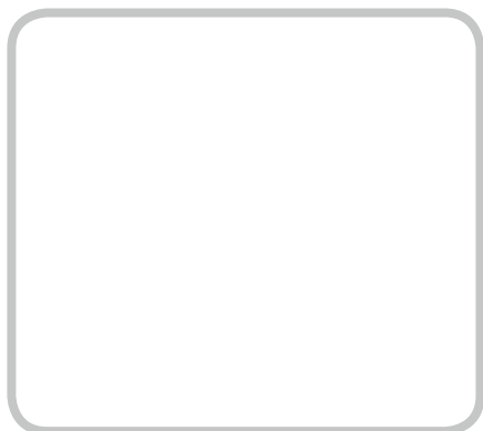
Disegno di Pedro