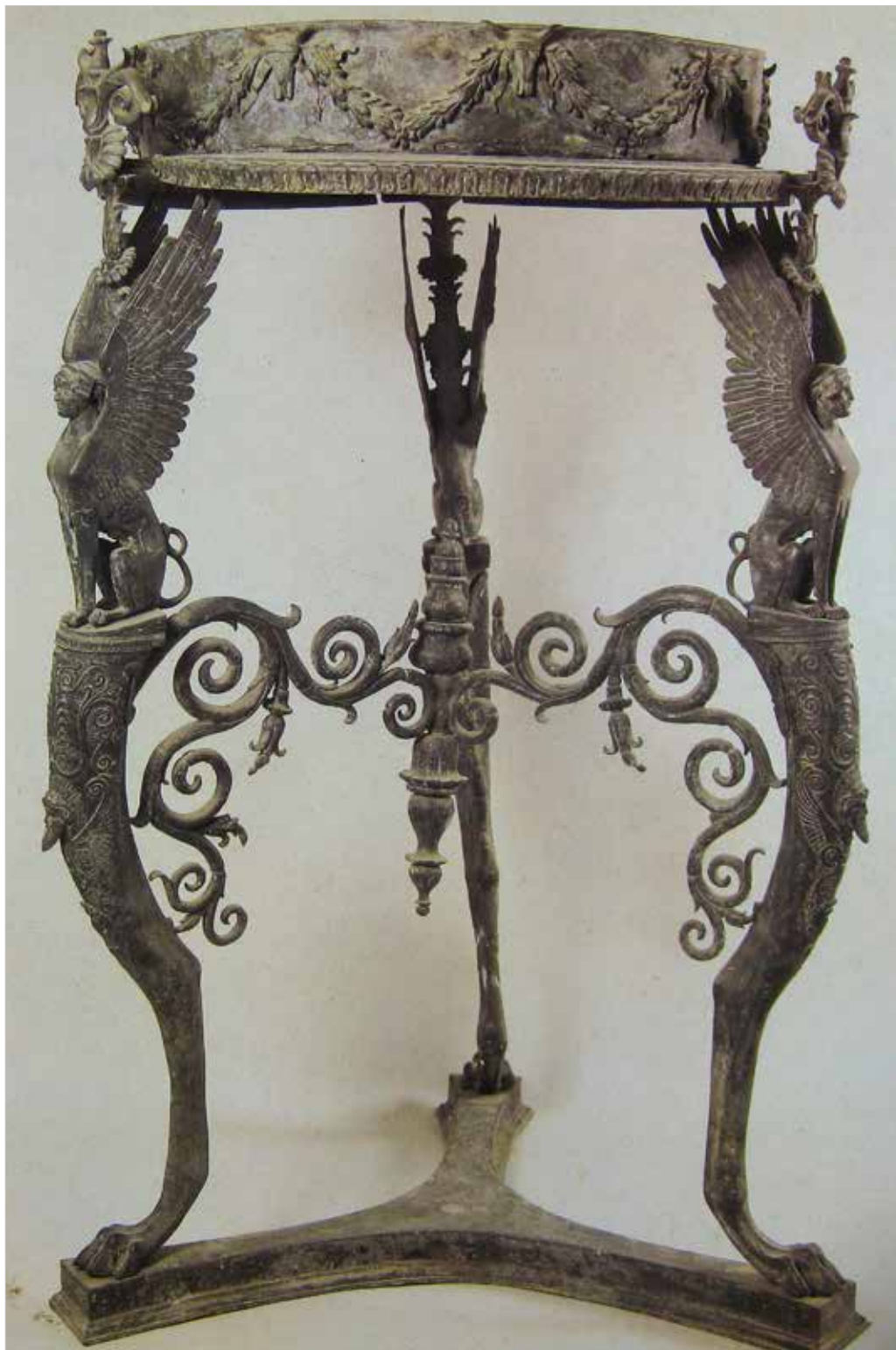
Tavolo di bronzo a tre sostegni da Pompei (VIII 7, 28), tempio di Iside (età augustea). Napoli, Museo Archeologico Nazionale.