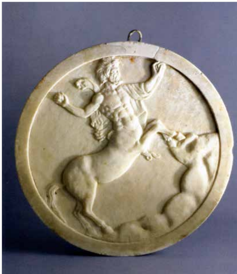
« Oscillum » con figura di centauro da Pompei (VI 16, 7.38), Casa degli Amorini Dorati (inizio del secolo I d.C.). Pompei, Depositi della Soprintendenza Archeologica.