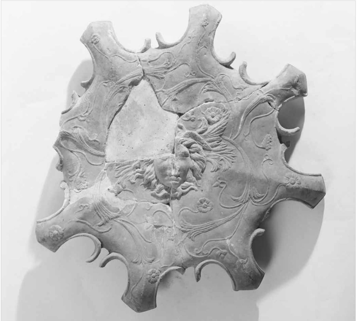
Lampadario dalla villa di Fianello Sabino (prima metà del secolo I a.C.). Roma, Museo Nazionale Romano, magazzini.