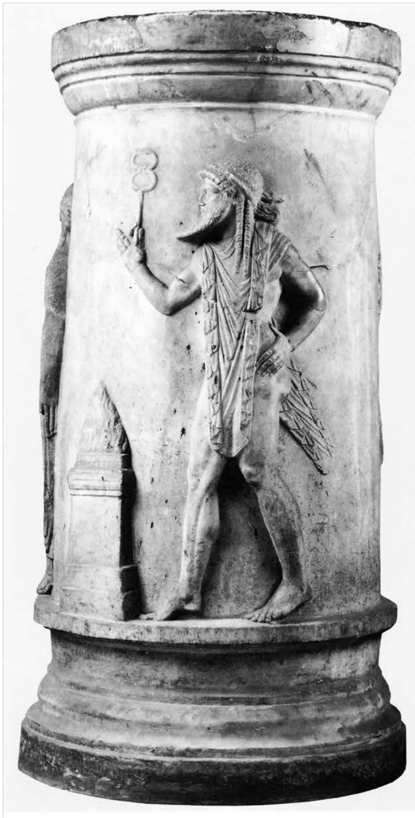
Ara circolare con teoria di divinità in stile «arcaistico», forse da Porto d'Anzio (metà del secolo I a.C.). Roma, Musei Capitolini.