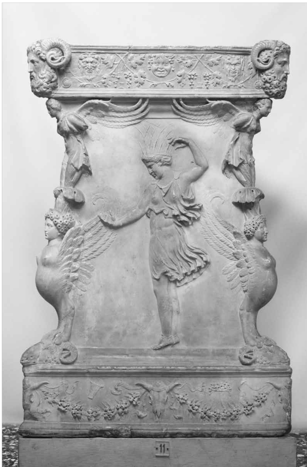
Base di candelabro con figura di danzatrice con kalathiskos (media età antoniniana). Venezia, Museo Archeologico Nazionale.