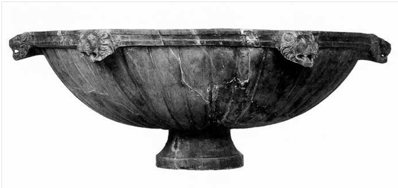
Labrum in bigio morato da Roma, via IV Novembre (età adrianea). Roma, Museo Nazionale Romano.