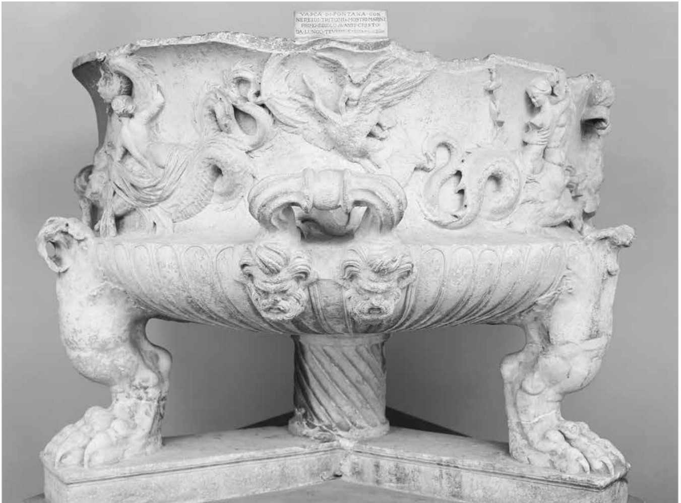
Tazza con corteo marino da Roma, rinvenuta presso l'ospedale di S. Spirito in Sassia (cronologia oscillante fra il 100 a.C. e la prima età augustea). Roma, Museo Nazionale Romano, Palazzo Massimo.