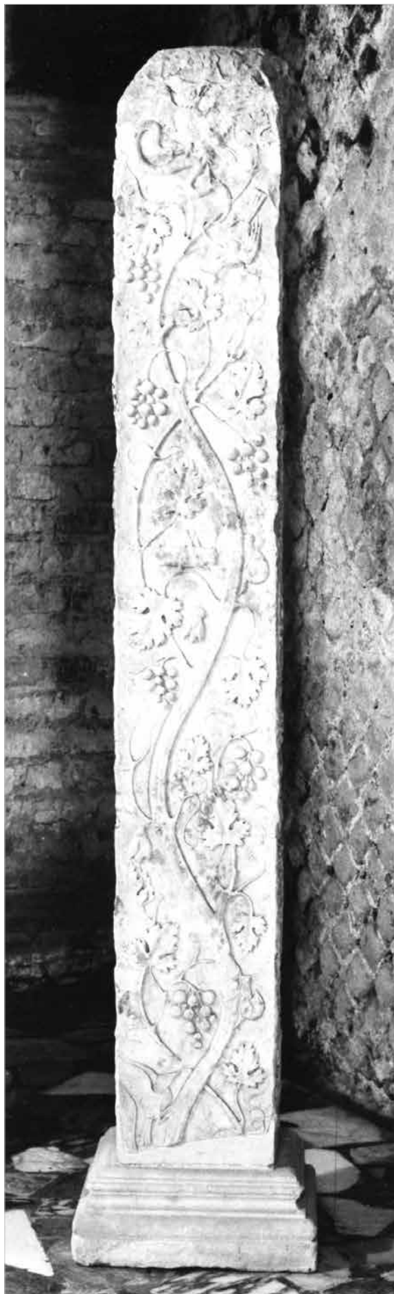
Pilastrino con decorazione vegetale da Villa Adriana (età adrianea). Tivoli, Villa Adriana, Antiquarium del Canopo.