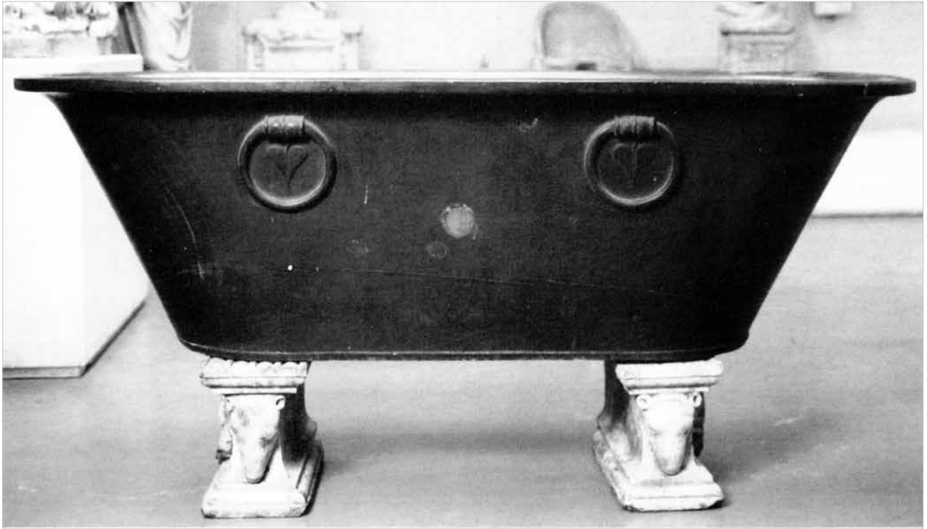
Vasca rettangolare in grovaccia (fine del secolo I-inizio del II d.C.). Londra, British Museum.