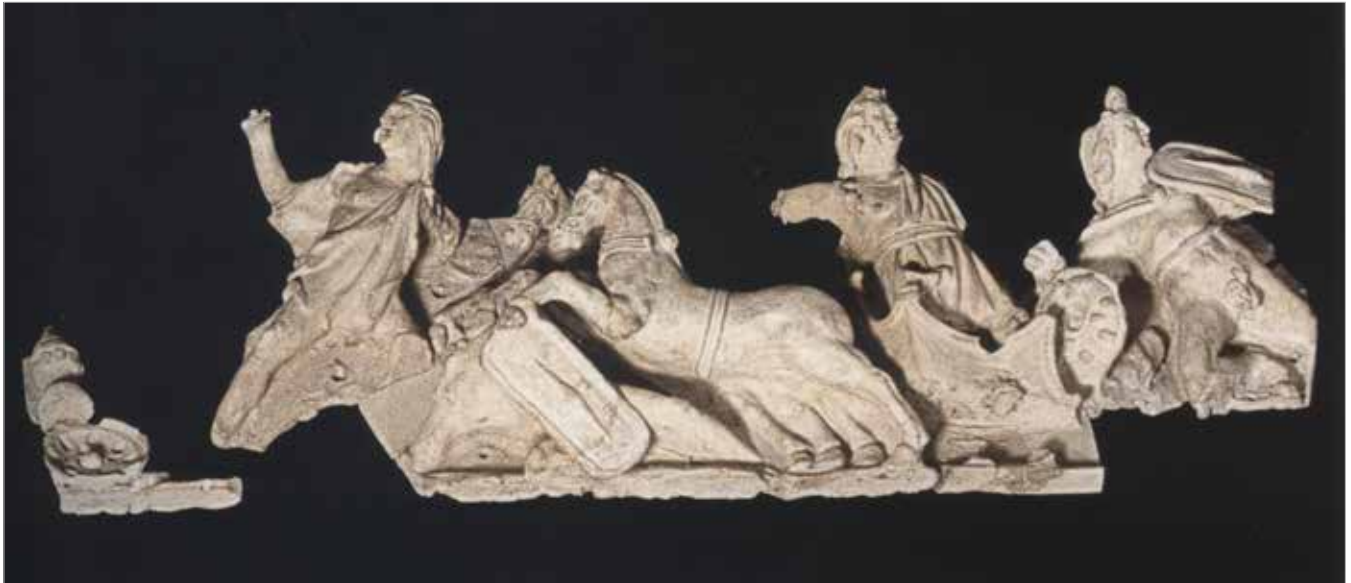
Fregio fittile con Galati in fuga, incalzati dagli dei protettori di Delfi, dal tempio di Civitalba (primi decenni del secolo II a.C.). Ancona, Museo Archeologico Nazionale.