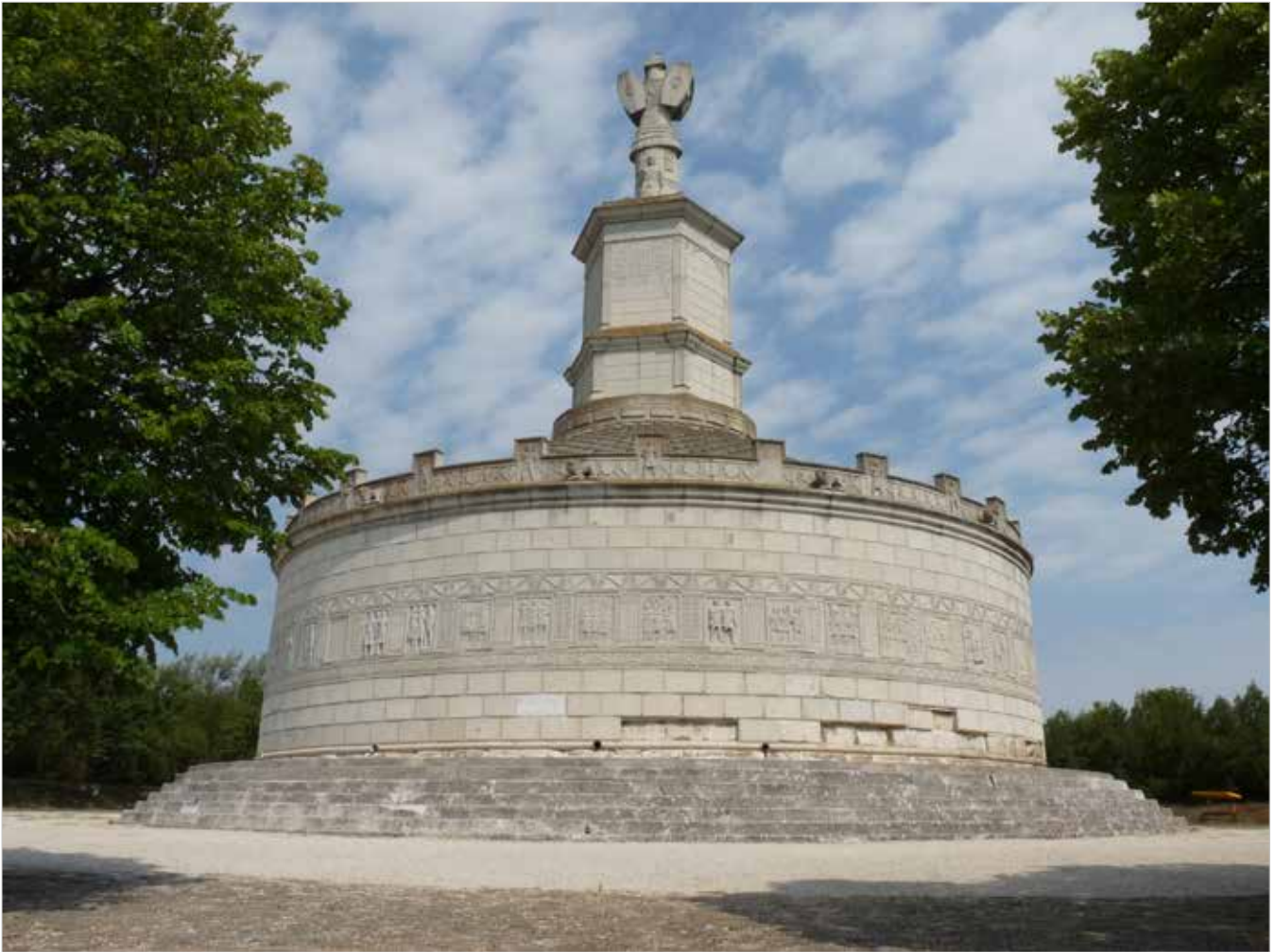
Romania, Adamclisi, ricostruzione del Tropaeum Traiani (109 d.C.).