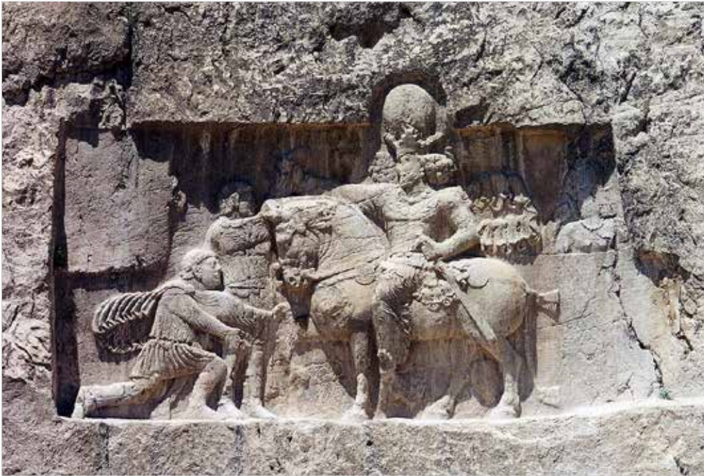
Il sovrano sasanide Shapur tiene prigioniero Valeriano, mentre Filippo l'Arabo s'inginocchia; rilievo in basso al centro della parete rocciosa con le tombe rupestri dei grandi sovrani di Persia (260 d.C.). Iraq, Naqsh-i Rostam/ Naqsh-e Rostam.