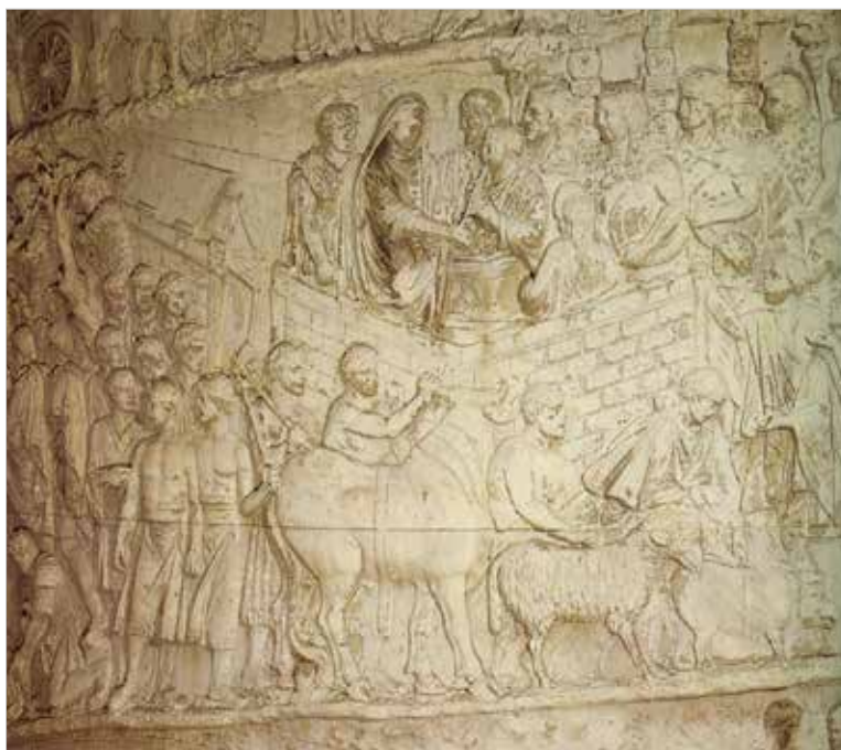
Roma, colonna Traiana (LIII) scena con veduta a volo d'uccello: Traiano togato in atto di libare all'interno del campo, dove sta per entrare la processione degli animali condotti da vittimari per il sacrificio dei suovetaurilia (113 d.C.).