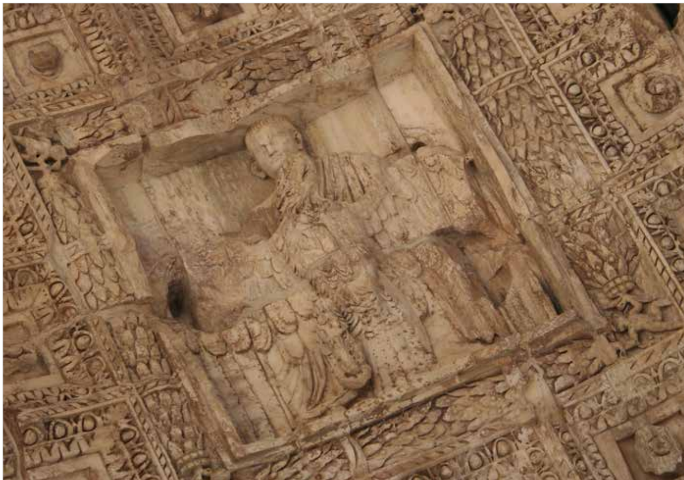
Roma, arco di Tito, scena con apoteosi del divo Tito sulla volta del fornice (età domiziana).