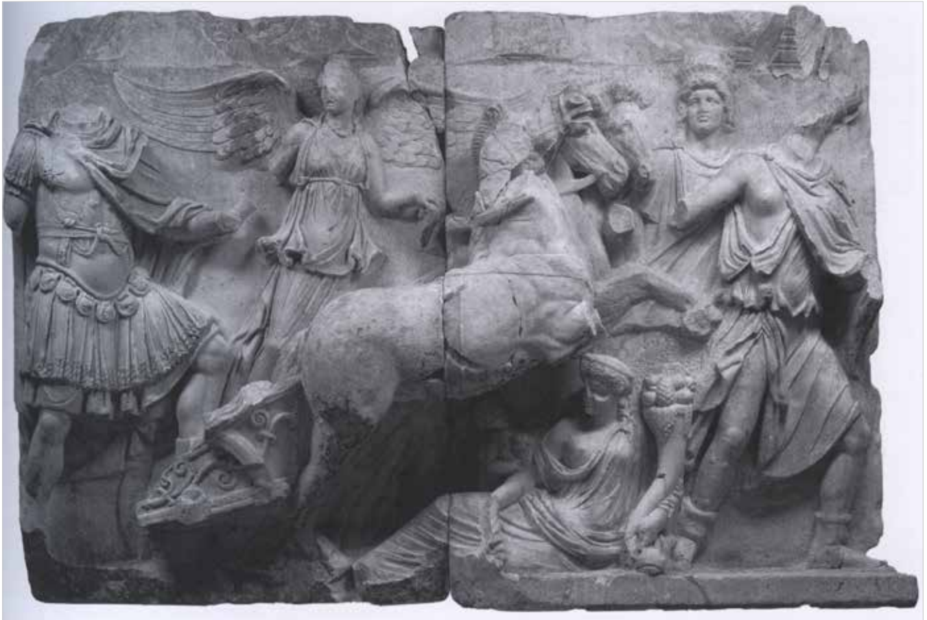
Scena di apoteosi di un imperatore dal «monumento partico» di Efeso (inizio dell'età antoniniana?). Vienna, Kunsthistorisches Museum.