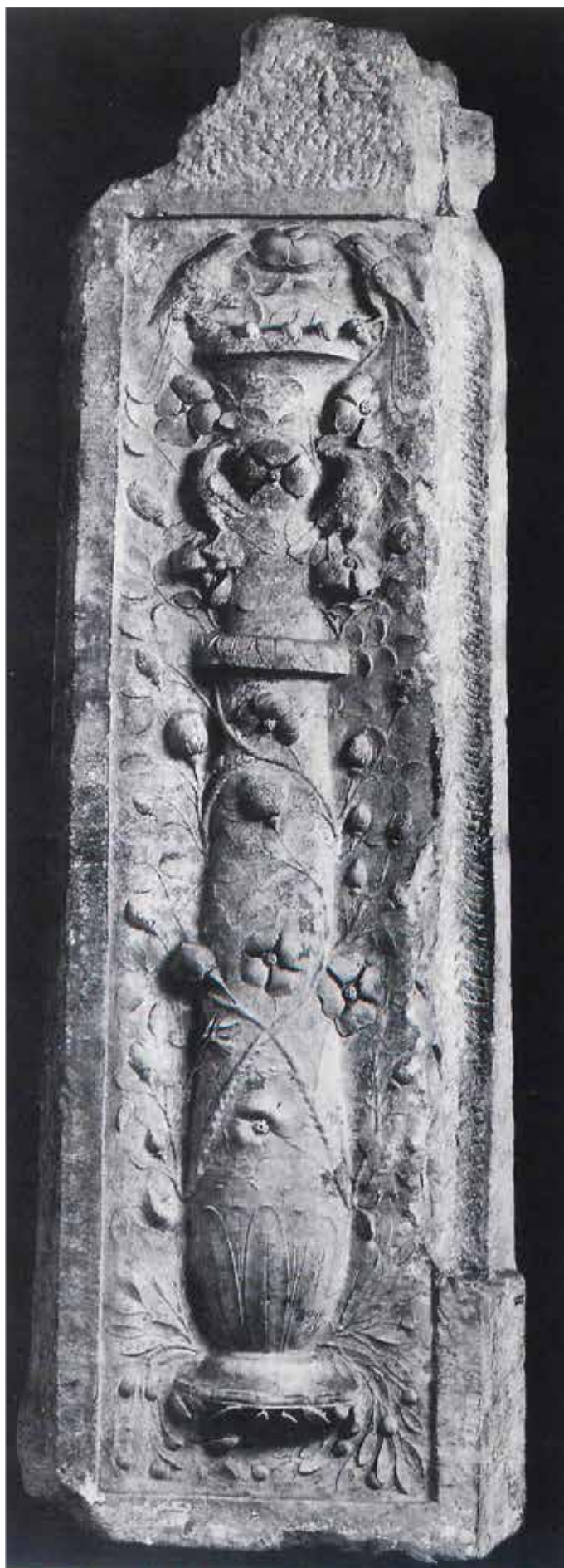
Rilievo dal sepolcro degli Haterii sulla via Labicana; raffigurazione di balaustro avvolto da tralci di rose e coronato da due uccelli (120 d.C. ca.). Città del Vaticano, Musei Vaticani, Museo Gregoriano Profano.