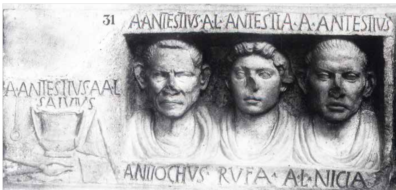
Rilievo funerario degli Antestii , che raffigura i membri di un'officina per la produzione di vasi in metallo, come si evince dagli strumenti del mestiere quali una tenaglia e un'incudine (età medio-tardoaugustea). Città del Vaticano, Musei Vaticani, Galleria Lapidaria.