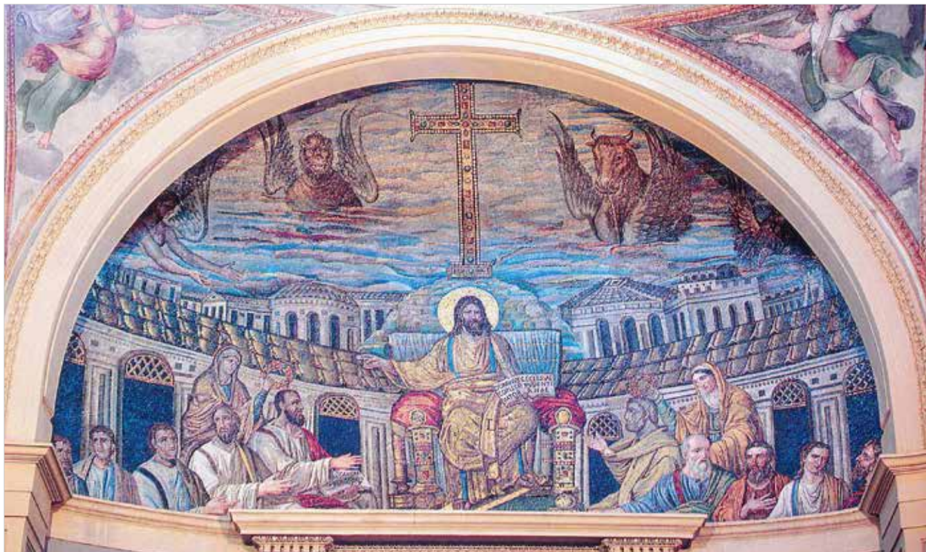
Mosaico absidale con il concilio di Cristo in trono tra discepoli, che si staglia davanti a un elaborato sfondo architettonico (Gerusalemme?), come nei rilievi dei secoli I-II d.C. dove gli edifici conferiscono maggiore solennità alle cerimonie imperiali raffigurate (402-417 d.C.). Roma, S. Pudenziana.