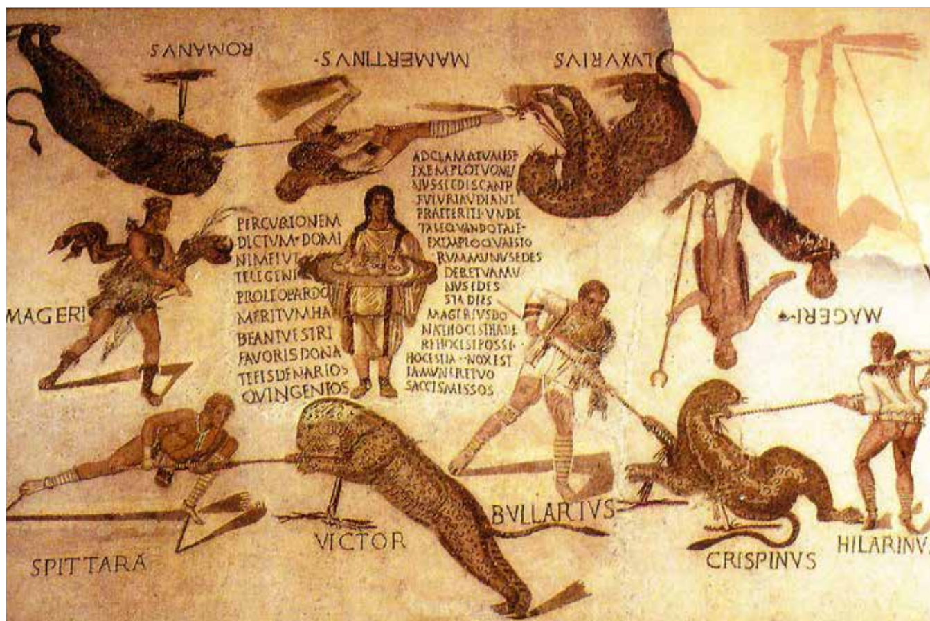
Su un mosaico proveniente da una villa a Smirat in Tunisia, venatores e fiere, tutti accompagnati da nomi, alla presenza di Diana e Bacco, si dispongono intorno a una lunga iscrizione che riporta un atto di munificenza da parte di un certo Magerius , l'organizzatore dello spettacolo acclamato dalla folla, che ai venatores concede sacchetti contenenti ciascuno una cifra doppia rispetto a quella pretesa, mille denari (metà del secolo III d.C.). Tunisia, Sousse, Musée archéologique.